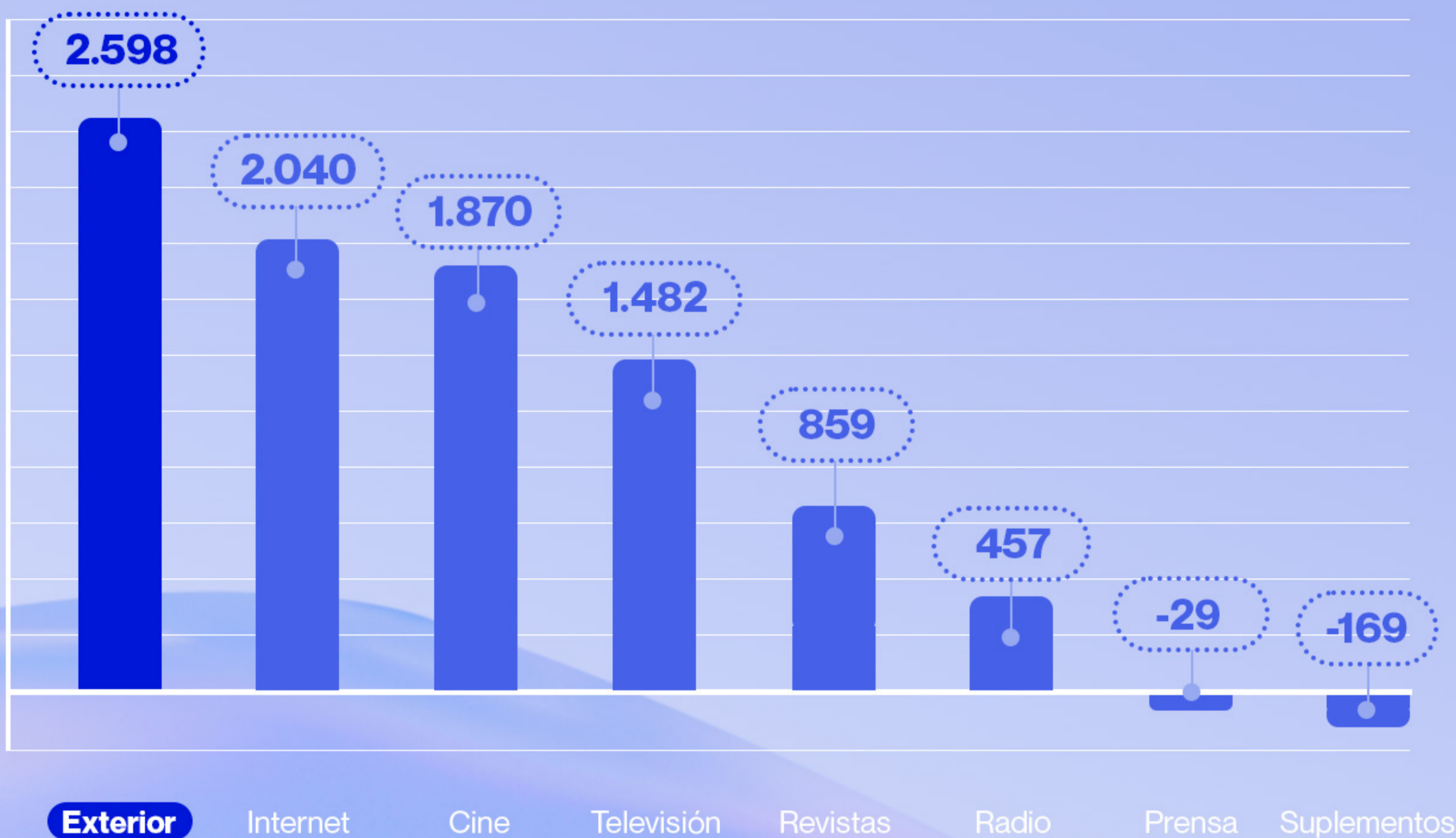
VARIACIÓN ANUAL* AUDIENCIA (000)

Exterior es el medio con mayor incremento absoluto en audiencia, incorporando en un año a más de 2,5 millones de individuos a la semana