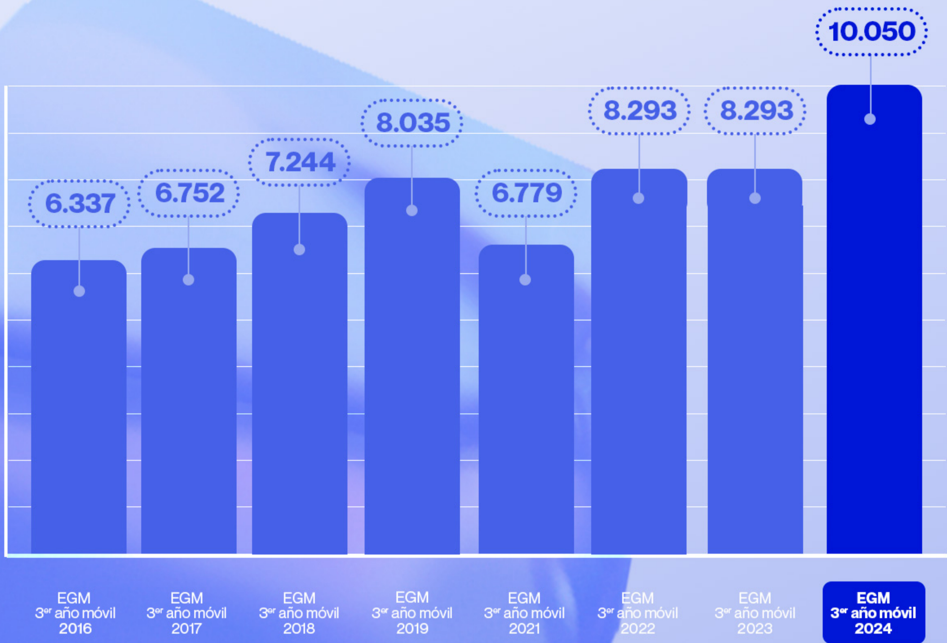
AUDIENCIA SEMANAL CENTROS COMERCIALES (000)