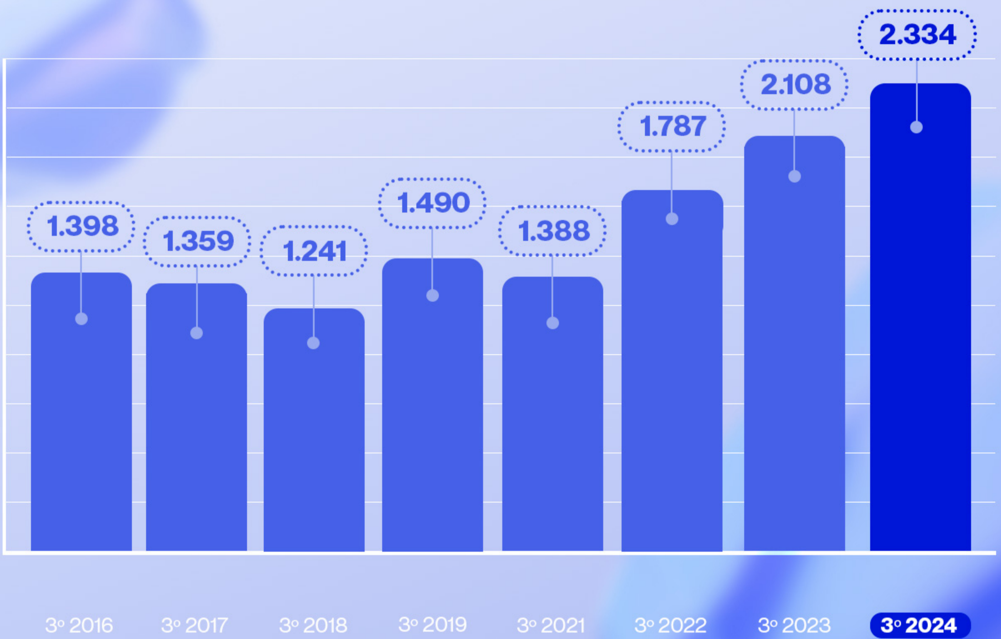
AUDIENCIA METRO DE MADRID (000)